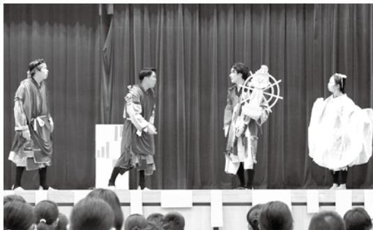
演撃戦隊ジャスプレッソ (玉城小学校)