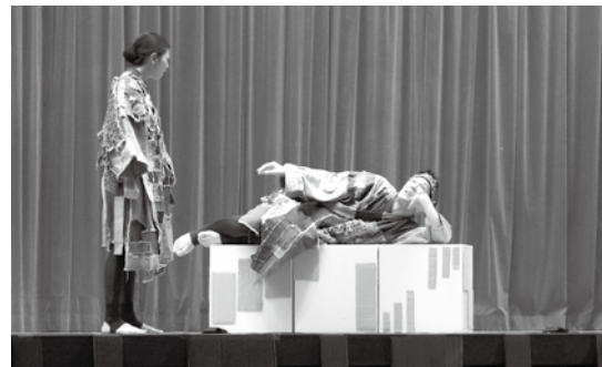
左：奥武観音堂由来 右：居眠次郎