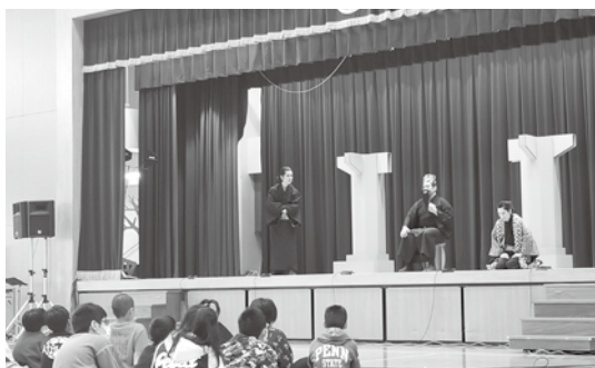
TEAM SPOT JUMBLE (馬天小学校) 左：モーイ親方 右：姥捨山