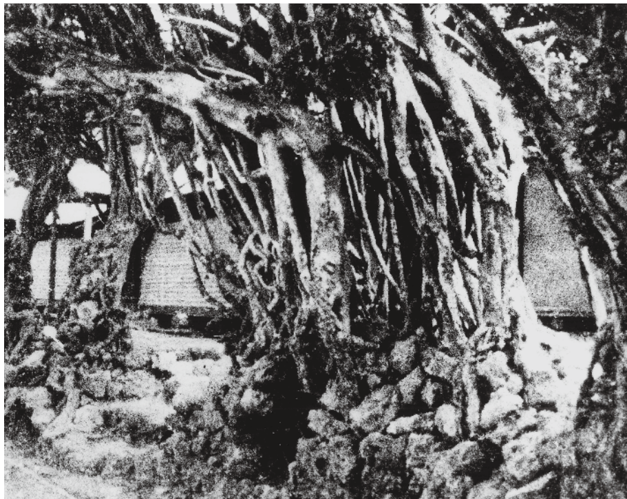
「ガジュマル 百名小学校」1952年 撮影・提供 太宰好夫氏（「沖縄戦体験の証言（玉城地域）」）