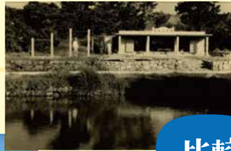
←現在の稲嶺公民館