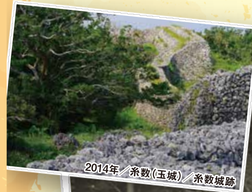
2014年/糸数(玉城)/糸数城跡