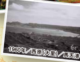
1960年/西原(大里)/馬天港