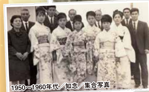
1950~1960年代/知念/集合写真