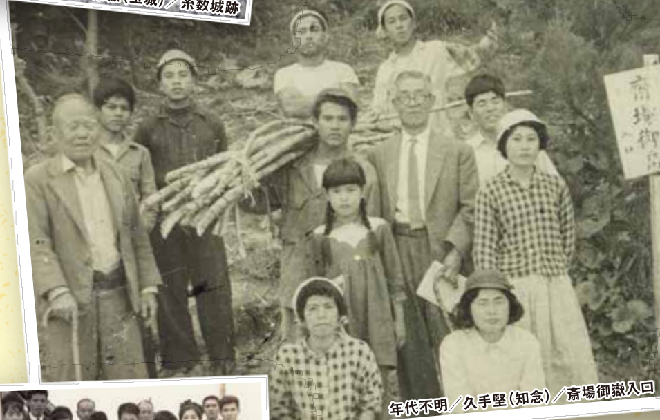
年代不明/久手堅(知念)/斎場御嶽入口