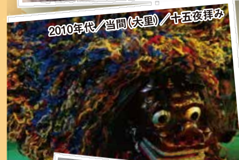
2010年代/当間(大里)/十五夜拜み