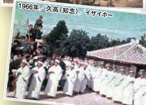
1966年/久高(知念)/イザイホー