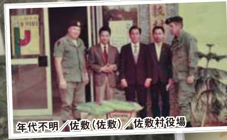
年代不明/佐敷(佐敷)/佐敷村役場