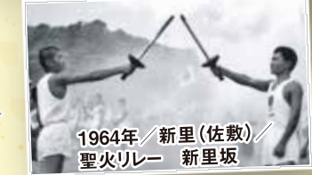
1964年/新里(佐敷)/聖火リレー 新里坂