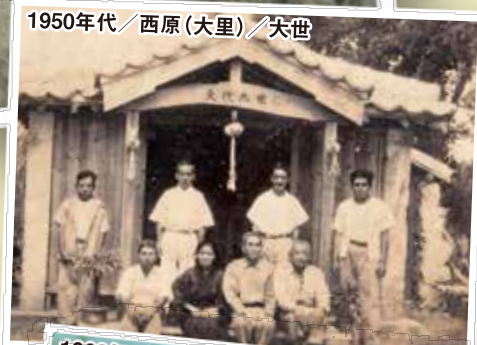
1950年代/西原(大里)/天世